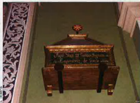
Arca amb les despulles de l'emperadriu Constança de Grècia, a Sant Joan de l'Hospital de València.

La desventurada emperadriu cercava el segur aixopluc de la seua neboda, Constança també, casada amb el príncep hereu Pere, que tan gran devia ésser. La família és fer-se i així ho