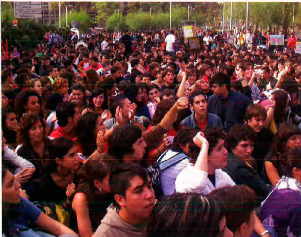
Els estudiants són sensibles als problemes que presenta l'ensenyament al nostre país, i per això es mobilitzen, al marge de les protestes que facln els docents.