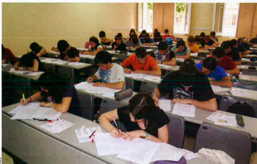
Segons els sindicats de docents, el mercat laboral valora massa poc la formació i els coneixements adquirits pels joves als centres d'ensenyament.

Gràcies a l'aprovació de l'Estatut, aquesta és la primera vegada que el govern de la Generalitat de Catalunya pot desplegar un model educatiu propi per llei. Però les bases per a l'elaboració de la futura Llei d'Educació de Catalunya (LEC) presentades pel conseller d'Educació, Ernest Maragall, a mitjan novembre ja han motivat discrepàncies entre els actors implicats en l'ensenyament. Els sindicats de professors s'hi mostren en contra i han convocat les primeres concentracions de delegats sindicals.