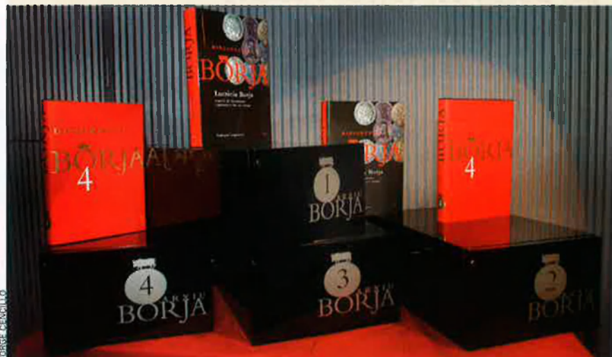
Les quatre capsas negres de l'Arxiu Borja, acompanyades de dues novetats: el quart volum del Diplomatari i una nova edició de la Biblioteca Borja : la Lucrècia de Gregorovius .