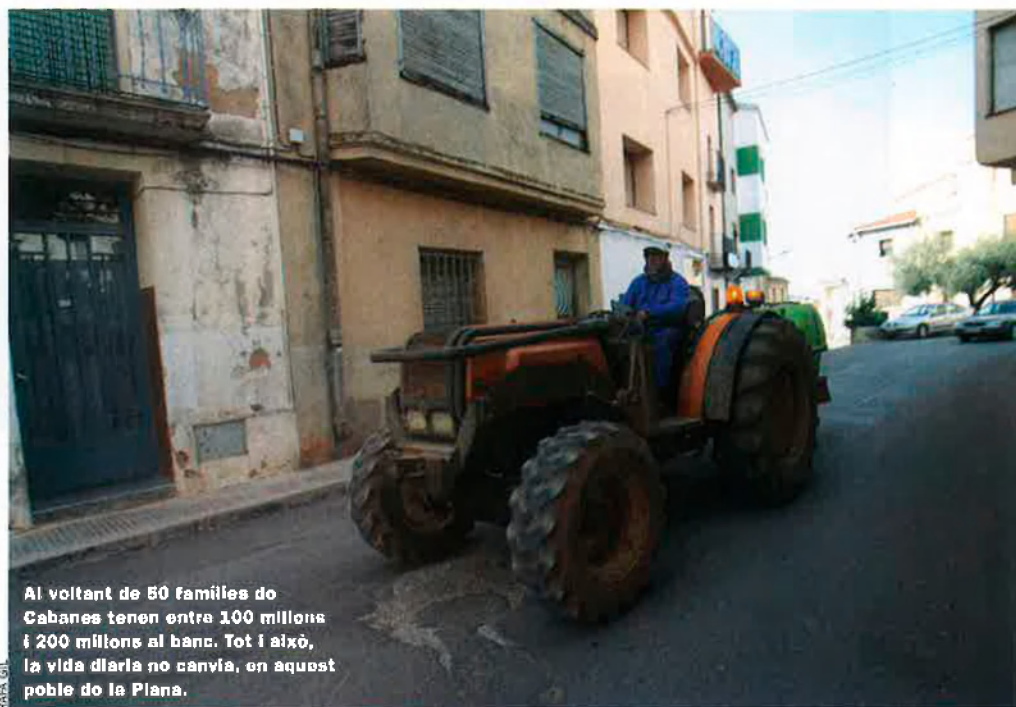
Al voltant de 80 famílies de Cabanes tenen entre 100 milions i 200 milions al banc. Tot i això, la vida diària no canvia, en aquest poble de la Plana.