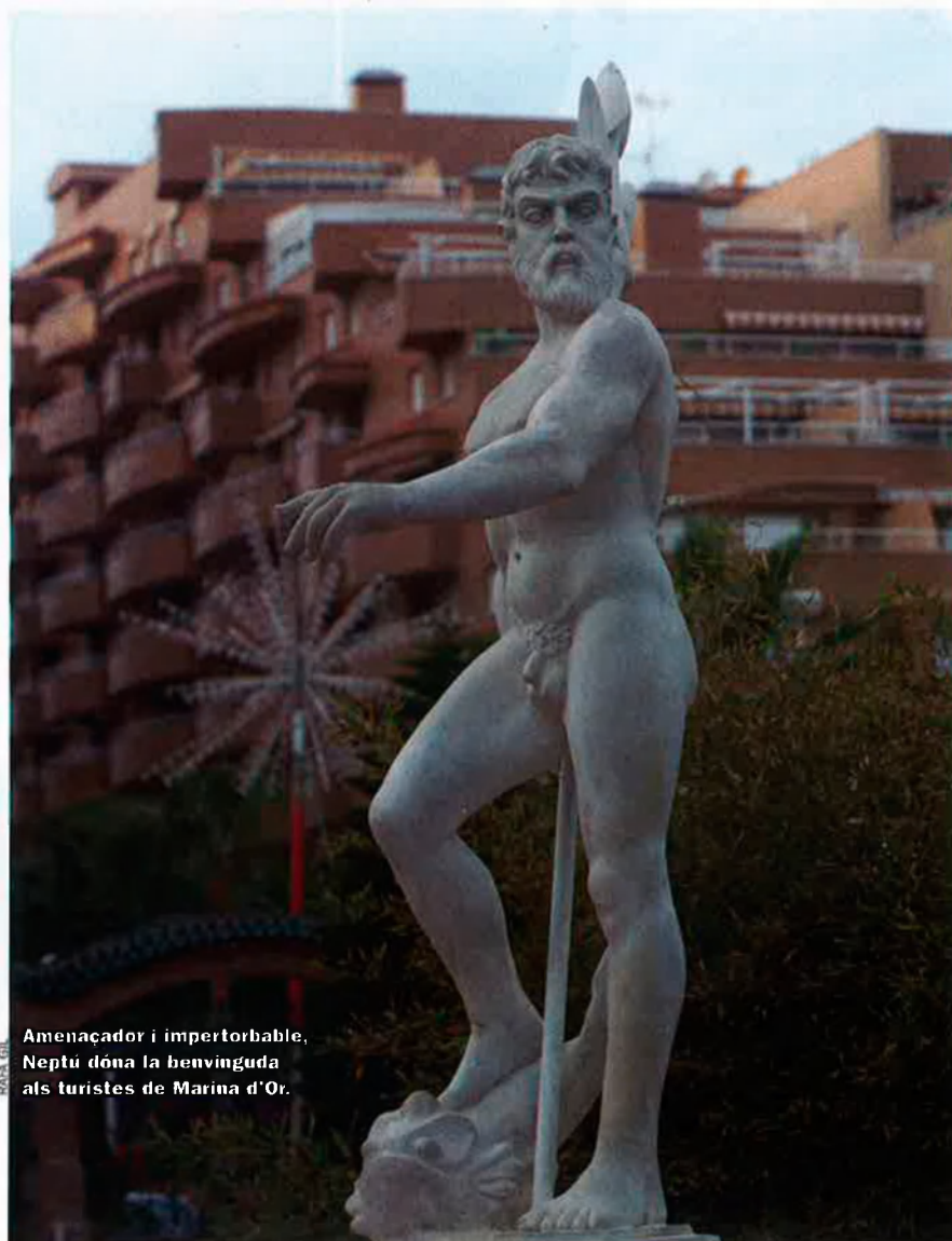
Amenaçador i impertorbable, Neptú dona la benvinguda als turistes de Marina d'Or.