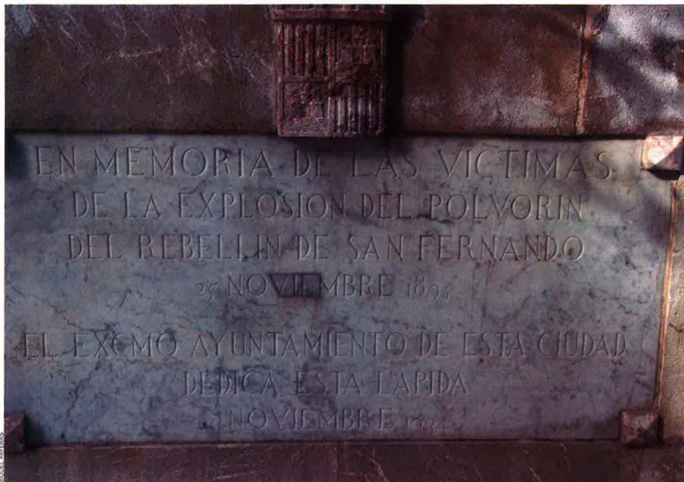
Placa en recordança de les víctimes de la tragèdia de 1895, instal·lada per l'Ajuntament de Palma durant la Segona República al lloc dels fets.

Les institucions balears homenatgen les víctimes de l'accident laboral més sagnant i més oblidat de la història illenca.