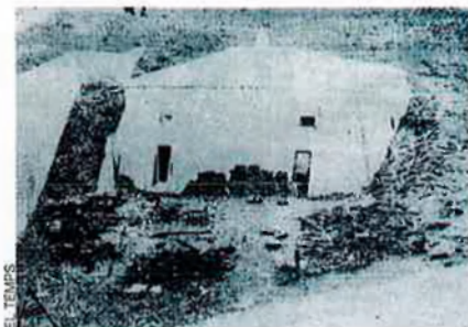
Imatge històrica del revellí de Sant Ferran de Palma, que explotà el 25 de novembre de 1895.

Va ser, i és, el pitjor accident laboral de la història de les illes Balears. Possiblement, un dels més sagnants de la història dels Països Catalans, i de l'estat espanyol. No obstant això, quedà a l'oblit ràpidament. Les institucions públiques reaccionaren com era norma aleshores. Desplegaren molta de caritat, però no assumiren cap responsabilitat i ni tan sols es proposaren de fer complir la llei vigent de protecció als obrers, i encara menys d'endurir-la. Això sí, organitzaren una capta de diners a través de donacions particulars i d'empreses per a les víctimes i familiars. La notícia transcendí les fronteres illenques. A Madrid, Barcelona, València i més ciu-