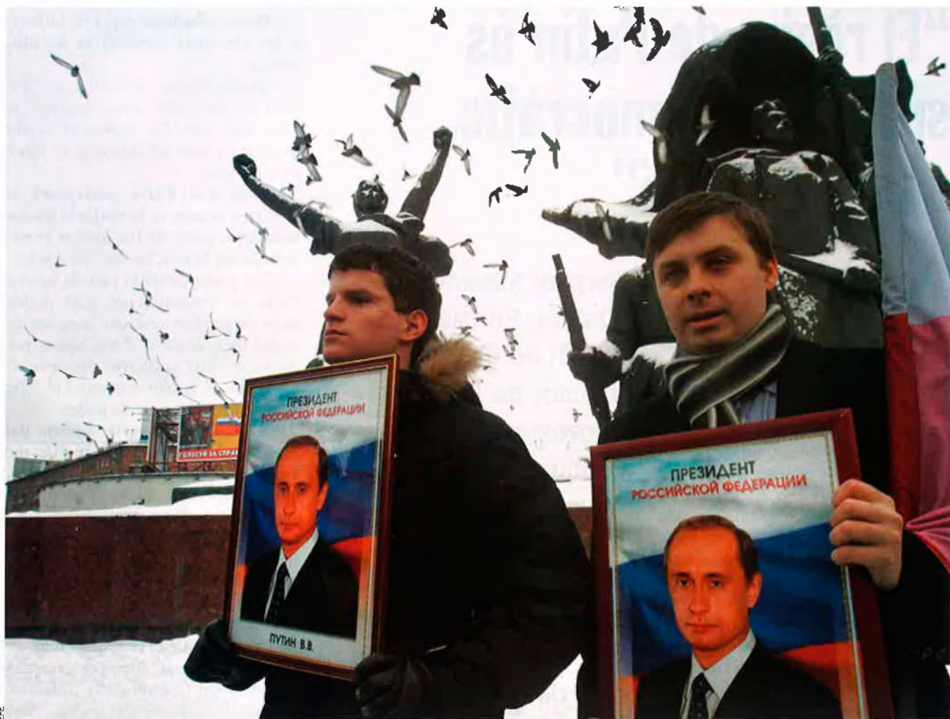
Dos activistes de l'oposició al president Putin van participar, el 17 de novembre a Moscou, en l'acte anomenat "Treu els retrats de Putin de les parets", per protestar pel culte a la personalitat del president que envaeix Rússia.