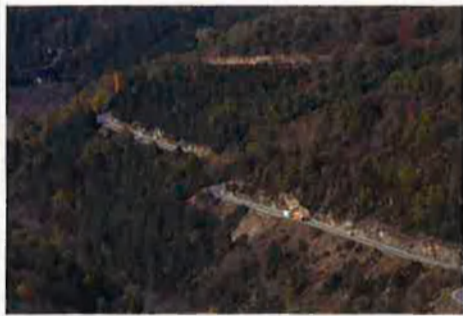
Vista de Ribes de Freser (Ripollès). El nou traçat de la N-152, que va de Ribes a la Molina (Cerdanya), ha aixecat controvèrsia entre els partidaris de preservar la riquesa ecològica i paisatgística de la vall i els qui volen millorar les comunicacions de la zona. Al costat, inici de la collada de Toses.

La sensació d'abandonament dels veïns de la vall de Ribes no es limita a la