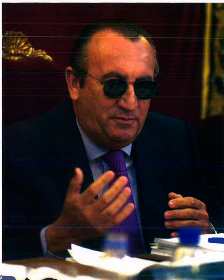
El cas contra el president de la Diputació de Castelló, Carlos Fabra, pareix encallat.

E l cas més important de suposada corrupció de la història a les comarques de Castelló, en què és investigat el president de la Diputació i del PP provincial, Carlos Fabra, per suposats delictes contra l'Administració Pública, reunions prohibides, falsificació de documents i frau fiscal,