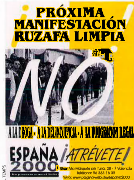
Cartell de la manifestació que Espana 2000 va organitzar al barri de Russafa (València).