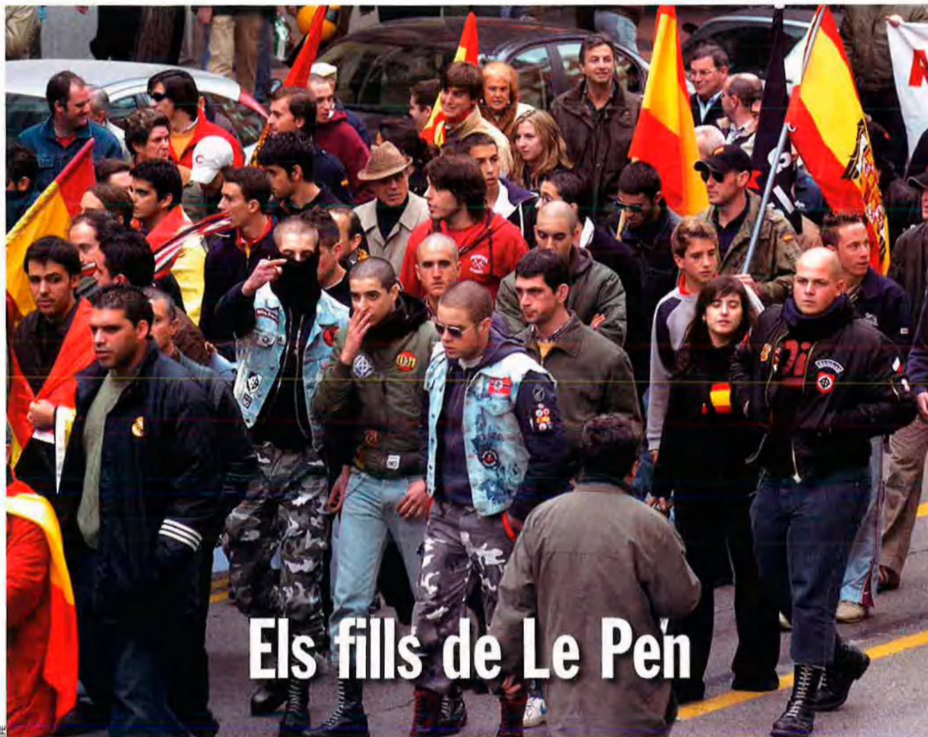
Malgrat els intents d'amagar l'estètica violenta, a les manifestacions treuen el bo i millor de cada casa.

Els vells camises blaves i els seus deixebles han deixat volar l'àliga del Generalísimo i amaguen els caps rapats darrere la porta. Es deixen créixer els cabells i ja no alcen el braç a la romana, perquè ja no sona el "Cara al Sol", sinó l'himne d'Espanya. Atents a les enquestes que mesuren les preocupacions dels ciutadans, els ultres deixen de banda la croada patrioter i carreguen els fusells per al safari. Ara el punt de mira és l'immigrant. L'equip d'investigació AIP ha detectat les passes que es fan a les ordres dels misteriosos líders feixistes amb interessos econòmics obscurs, en un curiós eix Catalunya - País Valencià - Madrid. Descubrim qui són aquests personatges i desgranem-ne els negocis i els antecedents. L'assassinat d'un jove antifeixista a Madrid centra l'atenció sobre aquests grups, però molts ja s'han ben camuflat sota la capa democràtica.