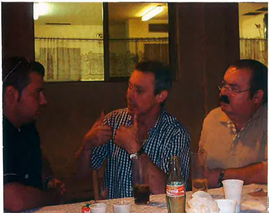
Al centre, José Anglada, president de Plataforma per Catalunya, el primer partit que va disfressar el discurs feixista espanyolista amb un embolcall de fals catalanisme.

sa que tradicionalment anaven a parar a l'esquerra. Segons la seua lògica, una plataforma política espanyola calcada del lepenisme només podria catapultar els ultres a obtenir representació insti-