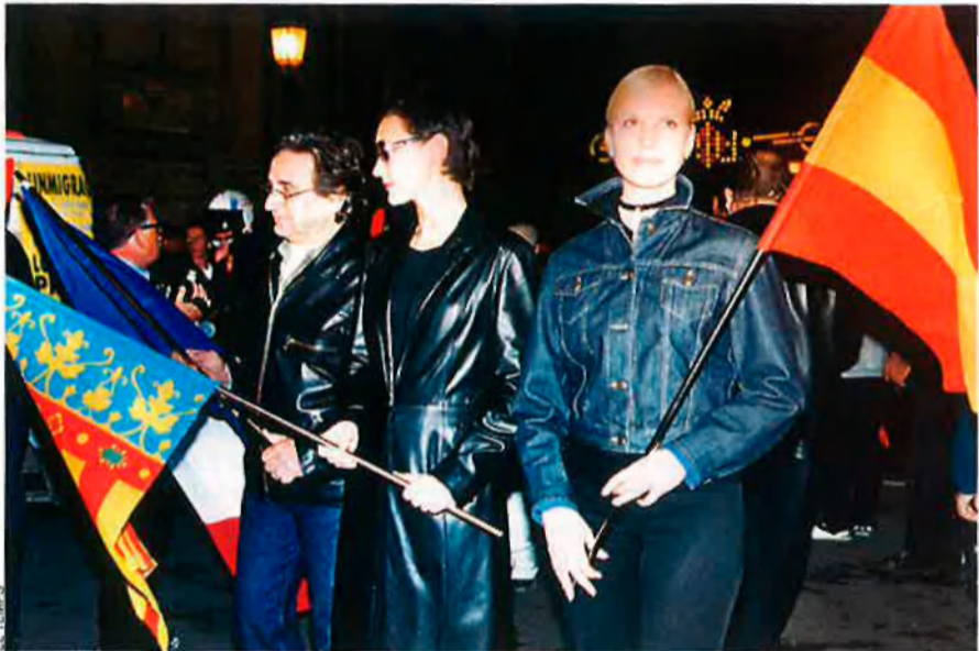
Les relacions del president d'Espana 2000 amb el món de la prostitució (vegeu EL TEMPS 1213) es fan evidents a cada acte públic del partit.

La banda dels cinc. Al País Valencià, el futur de la ultradreta demana enfortir els feus on ja gaudeixen d'una certa presència, especialment a València, Silla, Castelló i Onda. A més, Espana 2000 destaca la intenció de doblar el nombre de militants i de multiplicar la presència mediàtica, especialment a internet, un dels principals puntals de la comunicació dels moviments ultres.