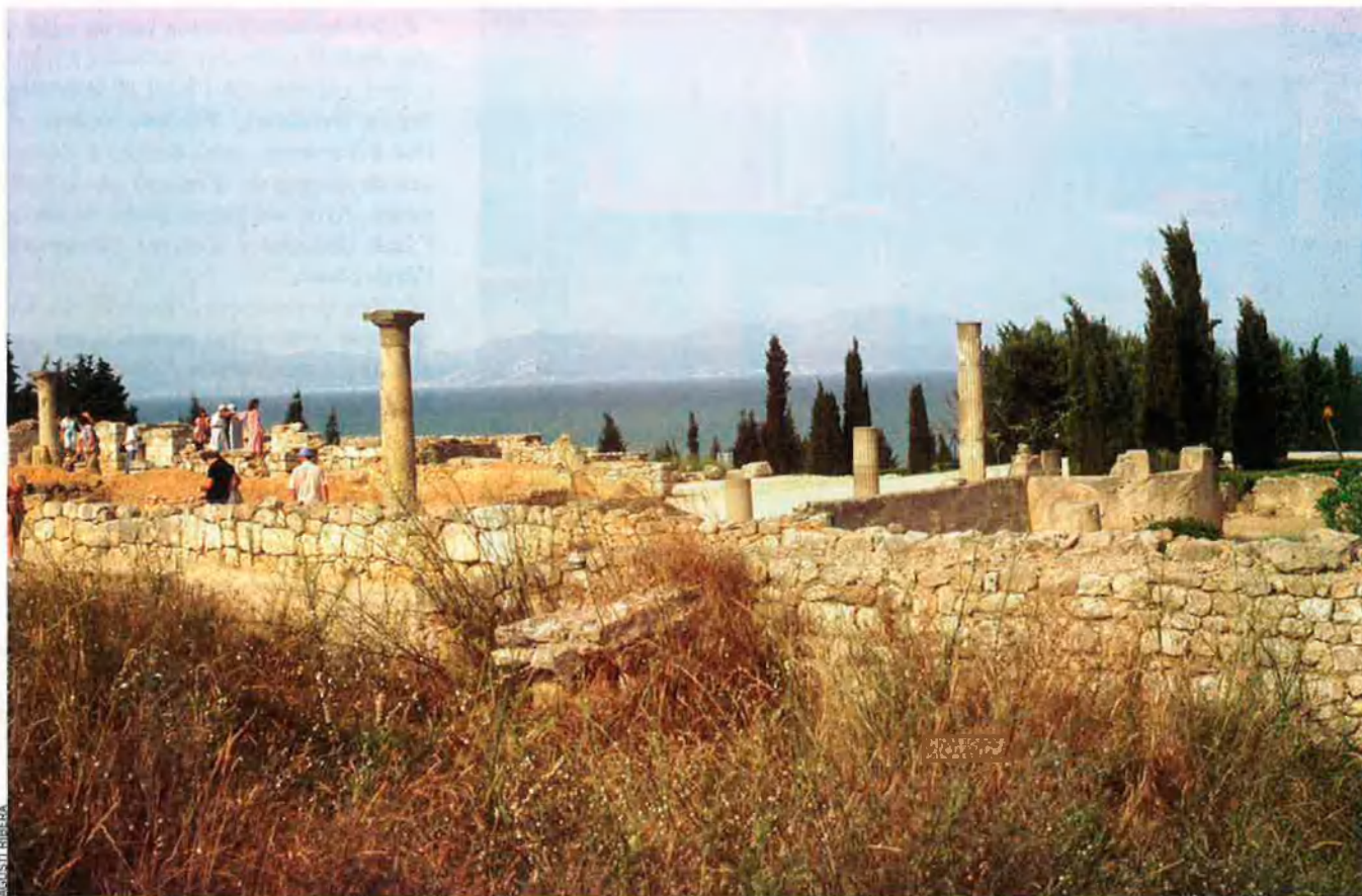
Els romans que van arribar a les costes mediterrànies, com ara els que van establir-se a Empúries, no parlaven llatí, sinó italià.

P ompeu Fabra, com també la majoria dels diccionaris, ja ho deia, potser sense ser prou conscient de l'abast de les seves paraules, però la realitat era la realitat: el romanç és el nom que rebia la llengua amb què, "per oposició al llatí", designaven llur idioma els qui parlaven una llengua romànica.