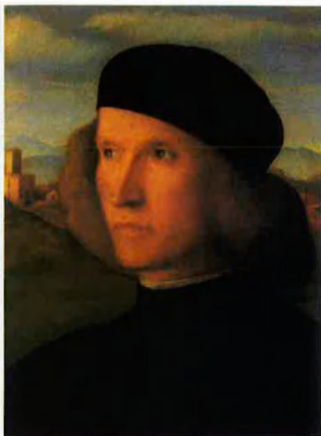
A MADONNA LYCRETTIA ESTENSE BORGIA DUCHESSA ILLUSTRISSIMA DI FERRARA.

Nissaga de poder. "La família Borja és la nissaga amb més rellevància internacional nascuda a terres de parla catalana. Aprofitant la commemoració del cinquè centenari de la mort de Cèsar Borja, l'IIEB i la Fundació Ausiàs Marc dedicaran el II Simposi Internacional dels Borja als fills de Roderic de Borja, el papa Alexandre VI. A les ciutats de València i Gandia, experts de tot el món debateran al voltant d'aquesta família valenciana." Així és com es presenta el simposi que, durant tres dies, portarà a l'Octubre Centre de Cultura Contemporània de València