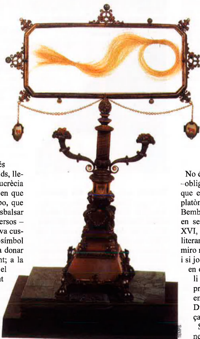
El floc de cabells de Lucrecia Borja, a la custòdia que el protegeix del pas del temps.

S'havien conegut el 15 de gener de 1503, en un ball, a casa de l'humanista de Ferrara Ercole Strozzi, que era amic de tots dos i