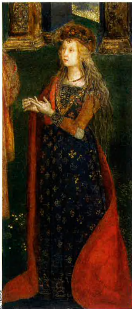
Lucrècia (al suposat retrat que li féu Pinturicchio, com a santa Caterina) i Bembo (en un altre suposat retrat, ara de Giovanni Bellini) van tenir una intensa relació. El poeta li va dedicar la seva obra Gil asolani .

Byron va difondre les cartes de Lucrècia a Bembo. No podia ser que un home apassionat com ho era ell, a qui agradava de contemplar les amants en un lent pentinar-se els cabells, restés impassible davant el floc daurat que li mostraren a la Biblioteca Ambrosiana de Milà, on es conservaven les cartes de Lucrècia al poeta. I diu que va