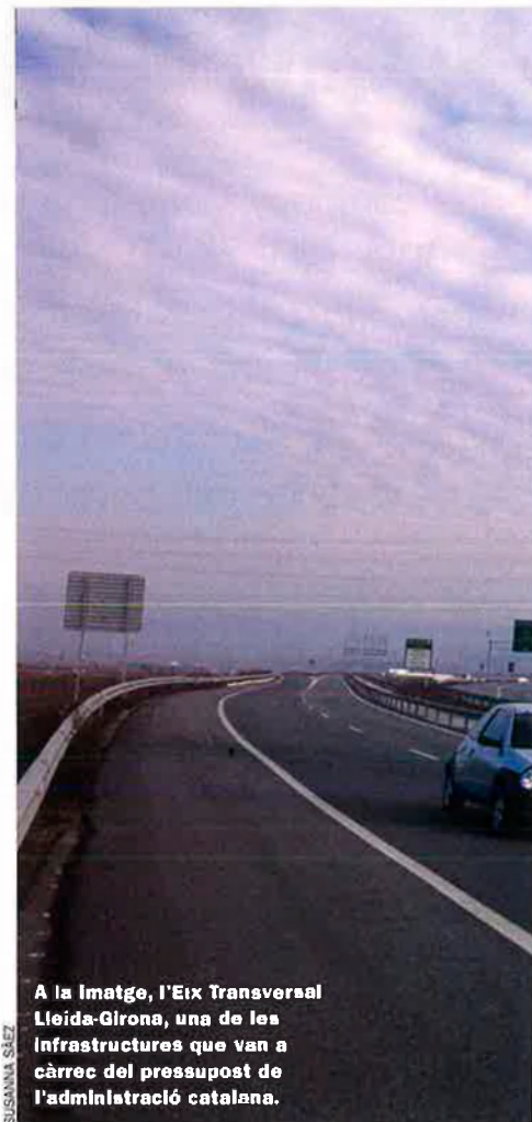
A la imatge, l'Eix Transversal Lleida-Girona, una de les infraestructures que van a càrrec del pressupost de l'administració catalana.

En segon lloc, no hi ha garanties escrites que el càlcul es faci aplicant les dues metodologies que va establir