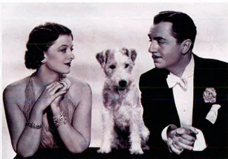
Bèsties famoses del cinema. A l'esquerra, la mona Xita al costat de Tarzan i Jane. A la dreta, la gosseta Asta, de la sèrie The Thin Man .

bada del cinema sonor i es convertí en el senyal anunciador que l'espectacle era a punt de començar a les sales de tot el món. A Slats, nom de la primera mascota, li succeïren més felins bramadors –Jackie, Tanner–, mentre el color n'alegrava el semblant seriós i ferotge. Els germans Marx, per al tràiler d' Una nit a l'òpera (1935) sabotejaren el logotip cinematogràfic i substituïren el rei de la selva en la marca cinematogràfica. I la parella Tom i Jerry, anys més tard, també s'encarregaren de rellevar la mascota felina per la seua versió cartoon . No fou aquesta l'última vegada que el símbol de la Metro fou pertorbat i el lleó reemplaçat per les més diverses ocurrències. Sense eixir del domini felí, gràcies a una sèrie televisiva, Daktari , hom va poder veure que animals i humans sabien compartir virtuts i defectes. En aquest cas, un lleó anomenat Clarence mostrava clarament els seus problemes d'estrabisme: fou el primer felí guenyo de la pantalla. Un defecte físic que, sens dubte, en una altra època hauria estat tot un entrebanc a l'hora de realitzar qualsevol càsting.