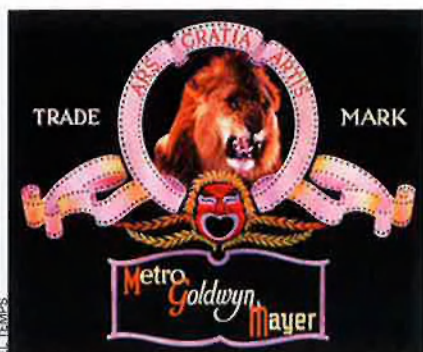
La companyia Metro Goldwyn Mayer ha tingut un lleó d'emblema des de 1924.

Però si hem de notificar un moment culminant pel que fa a punt d'encontre de mascotes en un plató cinematogràfic, assenyalem la primera versió de Doctor Doolittle (Richard Fleischer, 1967), el musical protagonitzat per Rex Harrison amb què la Ford pretenia continuar l'èxit de Somriures i llàgrimes ( The Sound of Music ) i que va comptar, entre més estrelles parlants , amb el gos Jip, el lloro Polynesia, el ximpanzé Chee-Chee i la foca Sophie. Prova de la magnitud de la producció van ser els sis mesos que els ensinistradors van esmerçar a ensenyar a Chee-Chee a fregir ous amb pernil. Només en la doma, l'alberg, l'alimentació i el transport dels animals la Fox es va gastar un milió de dòlars de l'època, que de segur que van contribuir a fer disparar les despeses i a convertir la producció en un dels disbarats més grossos de la història de Hollywood. I deixem de moment, en aquest bestiar de cel-