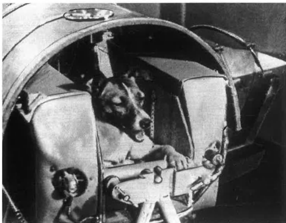
Ara fa cinquanta anys, la gossa Laika fou el primer animal enviat a l'espai. Tot i que l'URSS ho va amagar, Laika va morir al cap de poques hores per la calor i l'estrès.