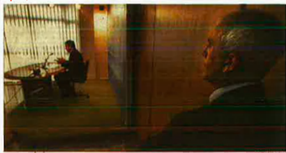
Pla explica bajo 'vigilancia' del constructor la ventajosa reforma de su casa