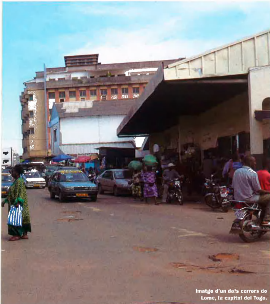
Imatge d'un dels carrers de Lomé, la capital del Togo.

als voltants de les esglésies, mentre una mica més amagats se celebren ritus vodús. Tothom hi és benvingut –“bien arrivéé”, és la frase amb què és rebut el visitant–; la convivència hi és aparentment harmònica.