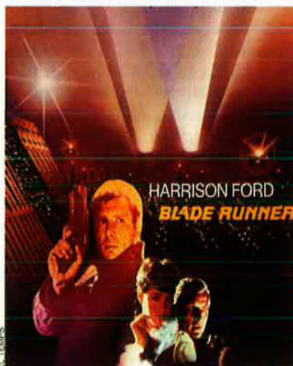
Cartell del film Blade Runner , que es va estrenar fa 25 anys.

Per una altra banda, el gran homenatge d'aquest quarantè festival anirà dedicat a un dels clàssics més influents i més indiscutibles del cinema fantàstic, Blade Runner , de Ridley Scott, que enguany fa 25 anys que es va estrenar. L'homenatge al mític film de Scott ja comença des del cartell del festival mateix, en el qual es pot veure la imatge representativa de sempre –la monstruosa i entranyable figura de King Kong– feta en papiroflèxia, i encarant-se a un unicorn daurat també fet de paper, una referència explícita al petit unicorn que el personatge de Harrison Ford elabora en un moment de la