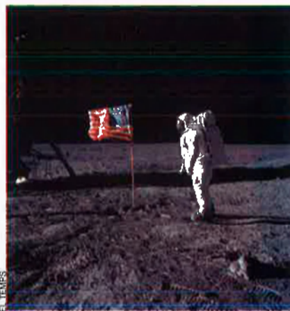
EL TEMPS Els americans van ser els primers a tocar la Lluna, però els russos es van avançar amb el primer satèl·lit, l'Sputnik, a sota.

El dia 4 d'octubre de 1957, l'URSS, sota el guiatge de Krhuitxov, va llançar el primer satèl·lit artificial a l'espai, que va batejar amb el nom de Sputnik, i emprengué així una cursa amb els EUA que va durar molts anys. En aquell moment, la situació que es vivia tant a l'interior de l'URSS com en les relacions internacionals era extraordinàriament complexa.