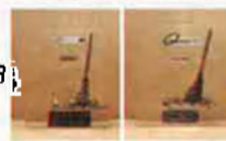
Escoba de plata 2006

A GANDIA, en 1998, vam ser guardonats amb l' Escoba de plata , per ser una ciutat pionera en la gestió mediambiental i de reciclatge. Ara, en 2006, tomem a ser guardonats amb l' Escoba de plata , seguim, a poc a poc, millorant en les polítiques ambientals. Apostant per idees innovadores: AIGUA POTABLE de qualitat, pla contra INNUNDACIONS i RADAR METEOROLÒGIC, ENERGIA SOLAR tèrmica, en noves construccions, espais NATURALS protegits. Catàleg d'ARBRES I ARBREDES d'interès local.