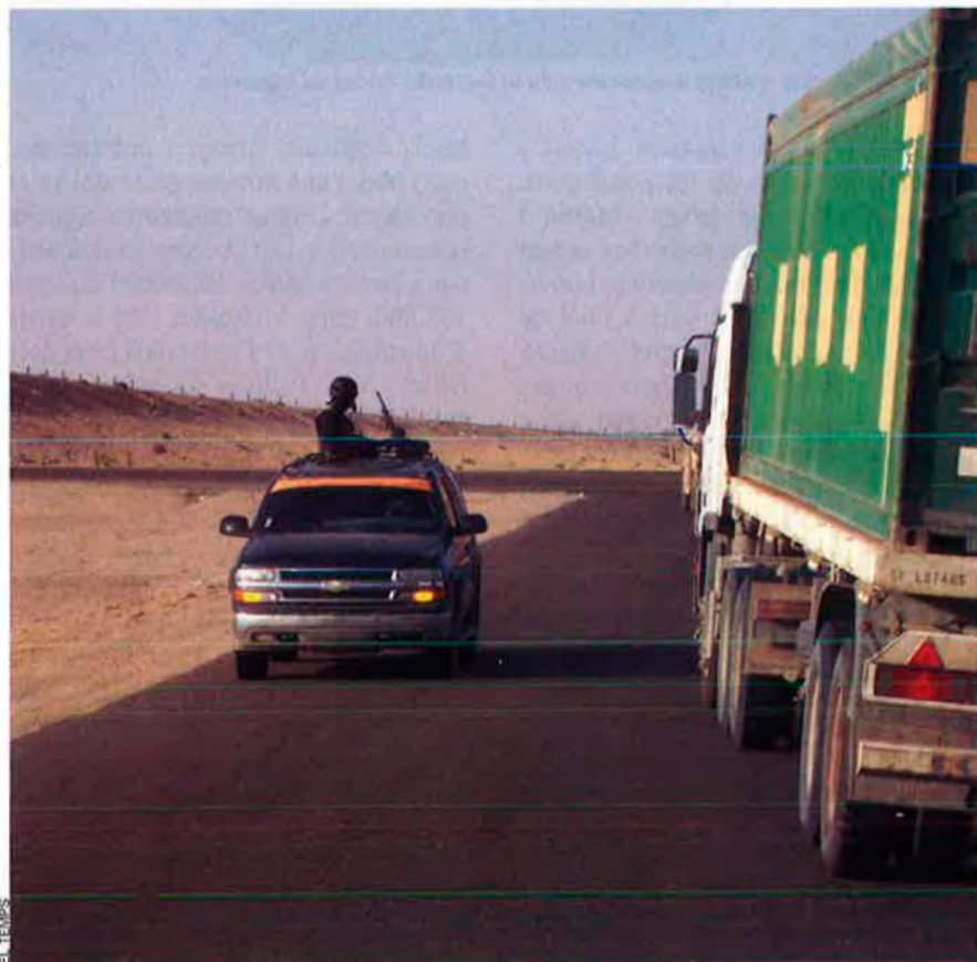
Mercenaris d'AEGIS patrullant a l'Iraq.

Tim de l'Iraq. 55 quilòmetres al sud-oest de Londres s'obre el comtat de