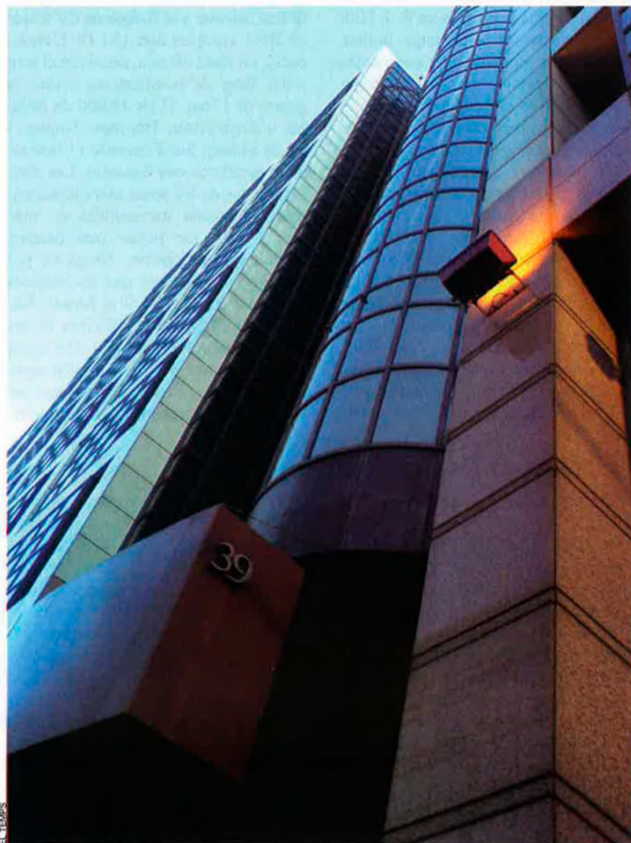
Oficines a Londres d'AEGIS Defence Services Limited, l'empresa encarregada de coordinar les companyies militars privades a l'Iraq.

Un any abans que esclatara la guerra de l'Iraq, AEGIS Defence no existia. Un any després, va rebre el contracte més important en la història de les operacions militars privades. La resposta és a dins d'aquests 2.440 metres quadrats d'oficines a Londres.