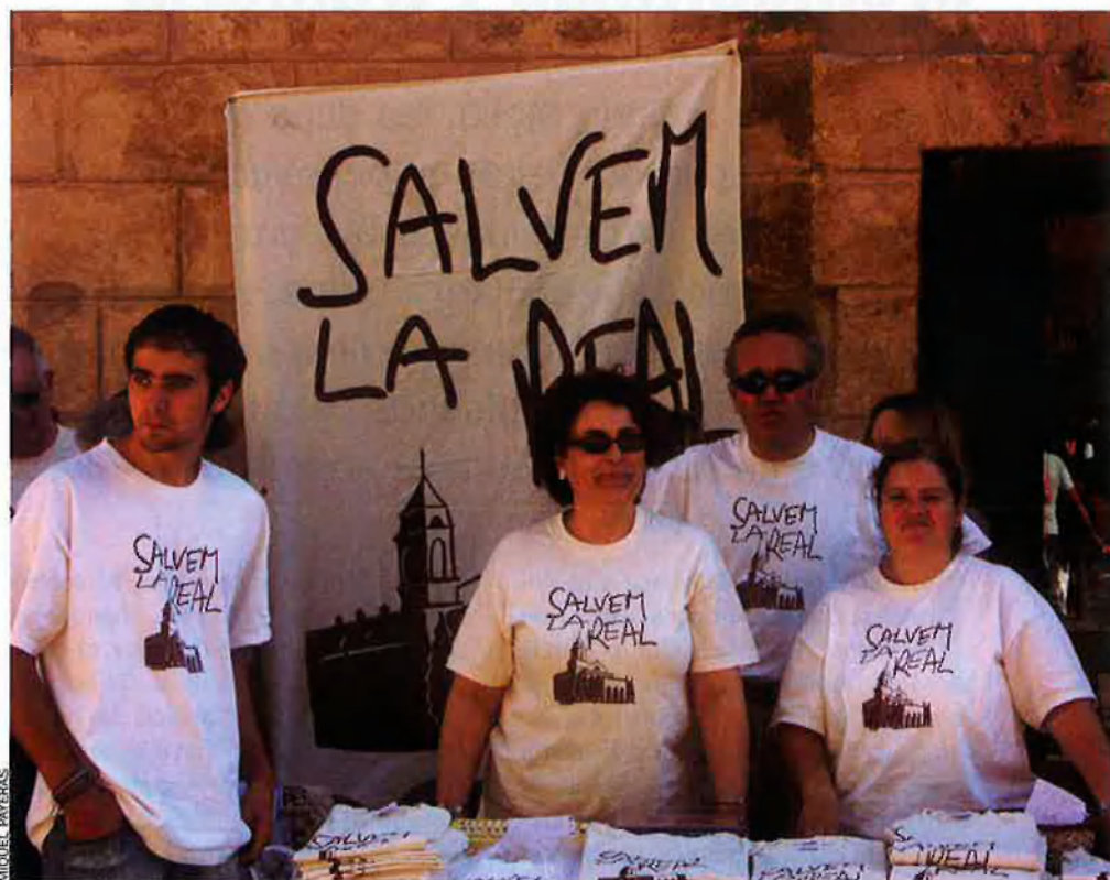
Recollida de signatures de la plataforma Salvem la Real a la diada de l’Obra Cultural Balear de l’any 2005.