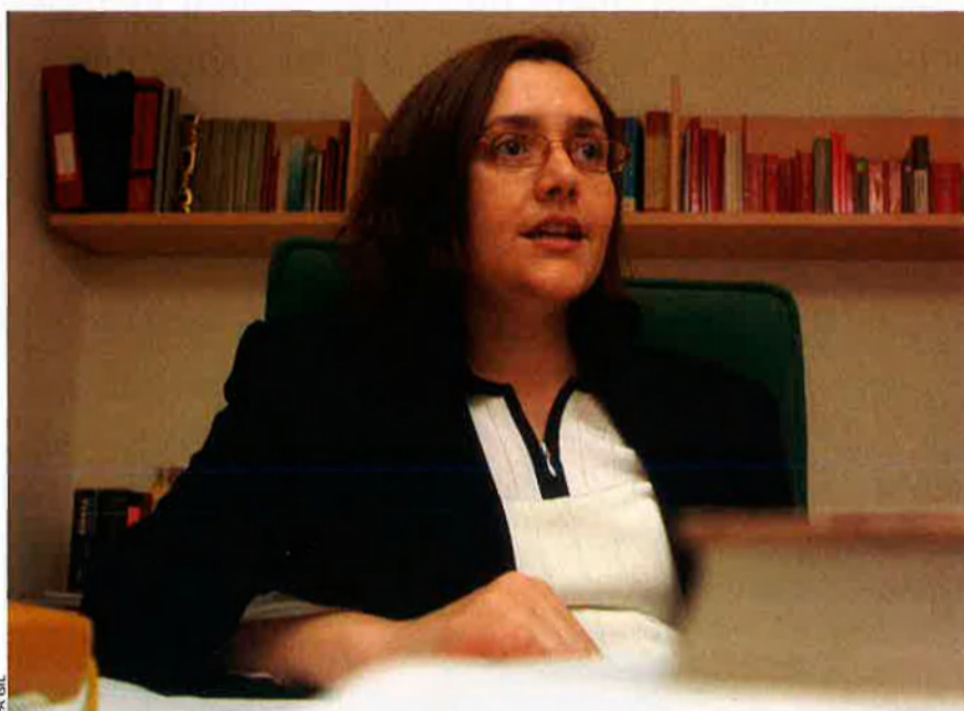
“L'administració valenciana no té competències sobre aquests canals. Amb la llei en la mà, no pot exercir-hi funcions d'inspecció ni sanció. No pot.”

farien. Contra això també podem anar al contenciós-administratiu.