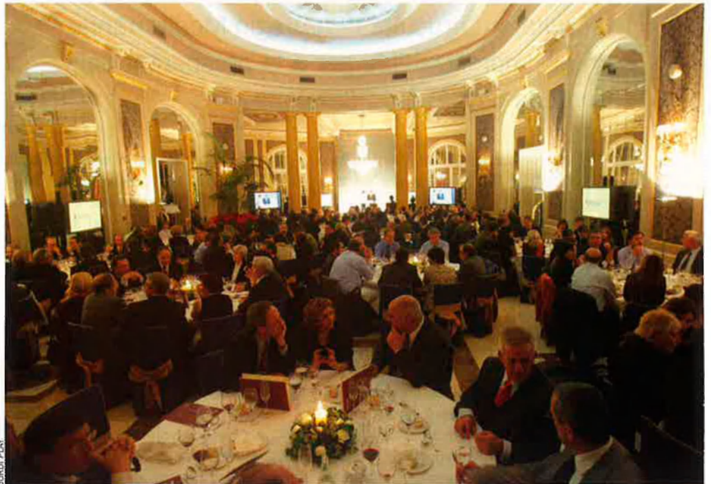
Sopar a l'hotel Ritz de Barcelona, dins les jornades sobre l'Euram organitzades per l'Institut Ignasi Villalonga d'Economia i Empresa.

Més enllà del món universitari, el món empresarial també ha començat a teixir els propis mecanismes de relació. El projecte de l'EURAM (Euroregió de l'Arc Mediterrani), impulsat per l'Institut d'Economia i Empresa Ignasi Villalonga, pretén promoure les relacions econòmiques i el desenvolupament de Catalunya, el País Valencià, les Illes Balears, a més