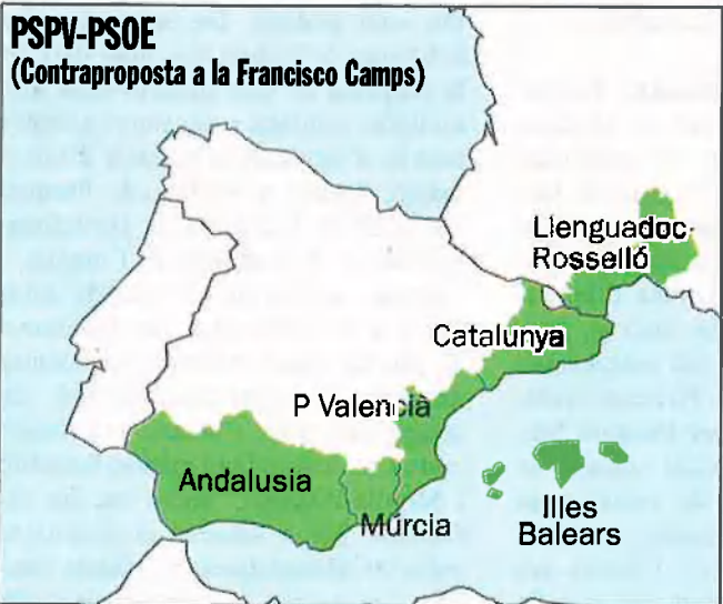
PSPV-PSOE (Contraproposta a la Francisco Camps)