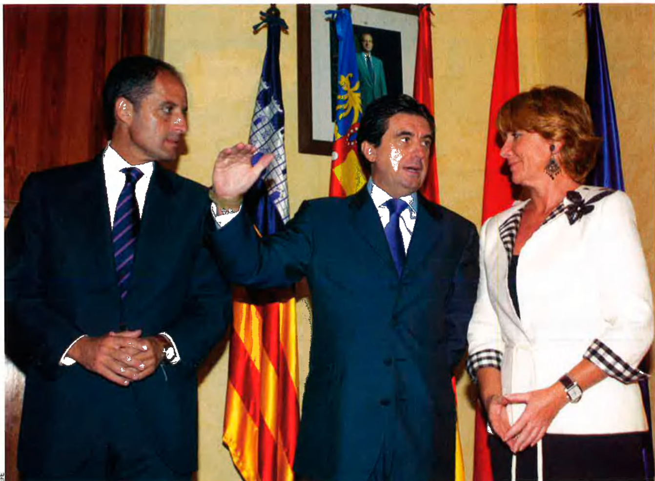
El 12 de juliol de 2004, a Palma, els presidents del País Valencià, les Illes Balears i Madrid van crear l'anomenat Eix de la Prosperitat.

d'agilitar unes relacions que de vegades han de superar més traves administratives que no pas de cap altra mena. En trobem un exemple ja als anys 70, quan entitats empresarials organitzaven intercanvis entre els territoris de l'eix mediterrani. Aquest és el cas d'una trobada, per exemple, organitzada per la Cambra de Comerç de Barcelona amb la Cambra de Perpinyà, el març de 1971. Ja aquells anys es considerava necessària la relació entre els territoris que hi ha a banda i banda de la frontera. Fins i tot Ernest Lluch escrivia un any abans, el 1970, un article al diari Tele/Express titulat "Entre Rosellón y Catalunya: una economia", en què defensava la necessitat d'establir relacions entre tots dos territoris. A l'article, Lluch escrivia: "Creiem que ja hem insistit prou en tot allò que passa a les zones catalanes de l'una banda i l'altra de la frontera; per això només caldria, si de cas, parlar de com encara en mit-