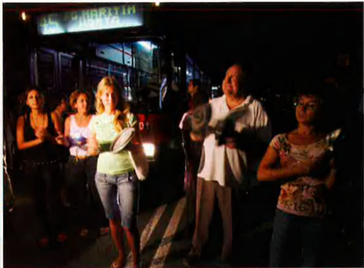
El caos d'infraestructures, que l'any passat va afectar principalment l'aeroport, s'ha estès enguany a la xarxa elèctrica de la ciutat de Barcelona. El desenvolupament econòmic es veu entrebancat per aquestes mancances.

que aquesta conversió ja es va produint en el cas de l'aeroport de Barcelona i el ferrocarril, de manera que "anem posant-nos al límit". En aquestes condicions, sentència el vocal del CGPJ, "l'esfondrament econòmic i social de Catalunya s'esdevindrà en un termini de cinc a deu anys".