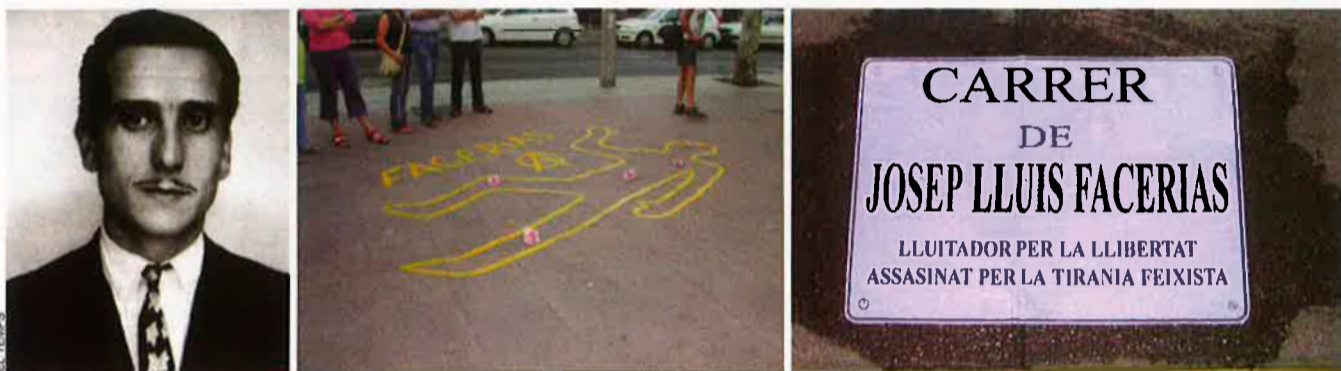
A l'esquerra, una fotografia de Josep Lluís i Facerias. Al centre, una silueta representa el cos del guerriller al lloc on va ser mort, durant un acte d'homenatge. A la dreta, una placa simbòlica serveix per a reclamar que el carrer on va ser mort en Facerias porti el seu nom.

En Facerias fou un dels darrers guerrillers anarquistes que van prosseguir el combat acabada la Guerra Civil espanyola. El 30 d'agost de 1957, ara fa cinquanta anys, fou abatut per la policia al barri de Sant Andreu, a Barcelona. Juntament amb Quico Sabaté i Ramon Vila, s'havia convertit en una autèntica obsessió per al règim franquista.