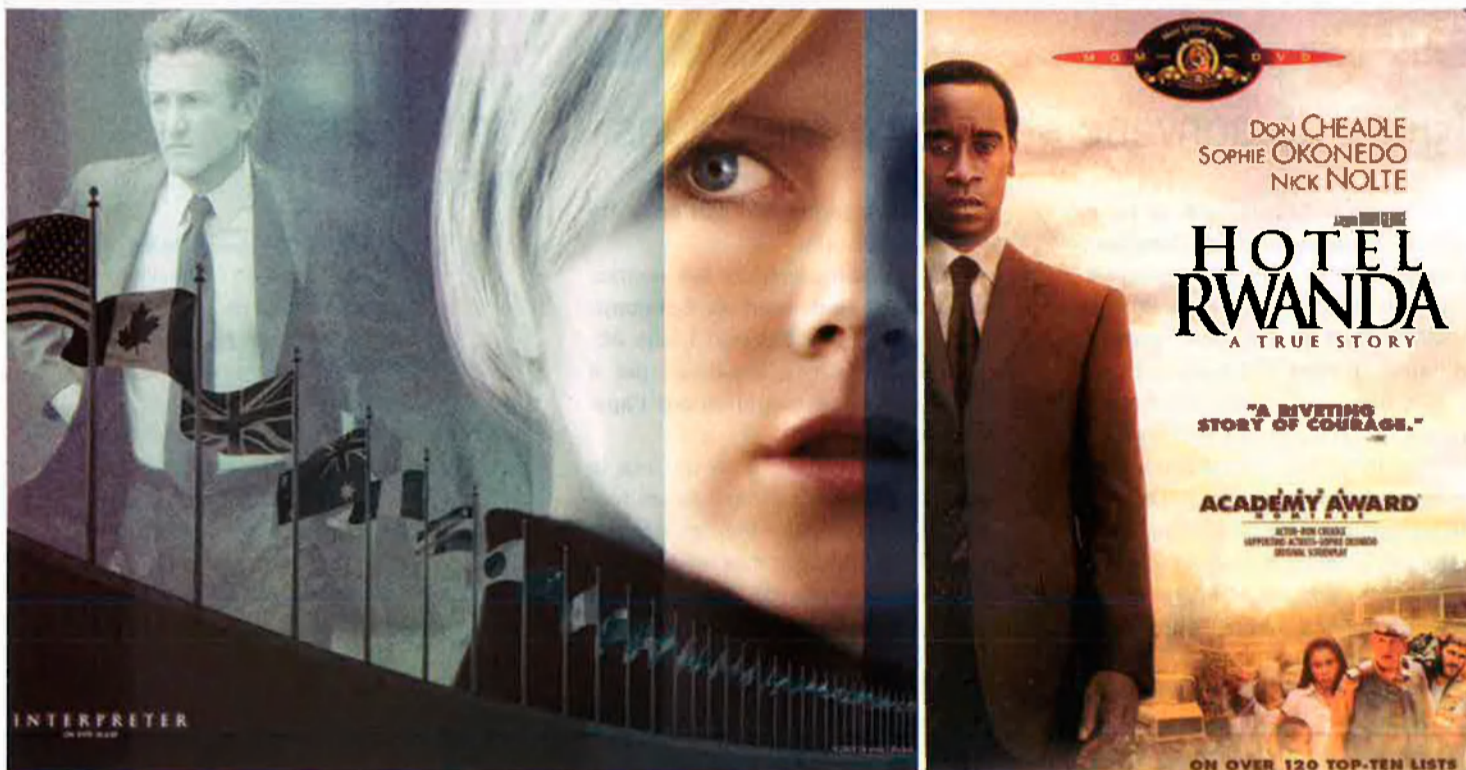
La intèrpret, de Sidney Pollack, o Hotel Rwanda, de Terry George, agafen el relleu de films dels 70 i dels 80, com Missing, Sota el foc o Els críts del silenci.