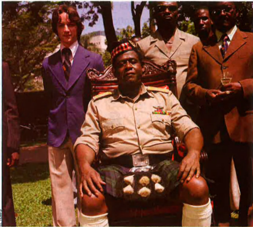
L'últim rei d'Escòcia, sobre el règim del pueril i bestial Idi Amin Dada a Uganda, és un dels films que difícilment hauria trobat productors el decenni passat.