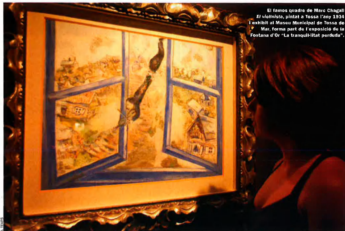
El famos quadre de Marc Chagall El viol·linista , pintat a Tossa l'any 1934 i exhibit al Museu Municipal de Tossa de Mar, forma part de l'exposició de la Fontana d'Or "La tranquil·litat perduda".