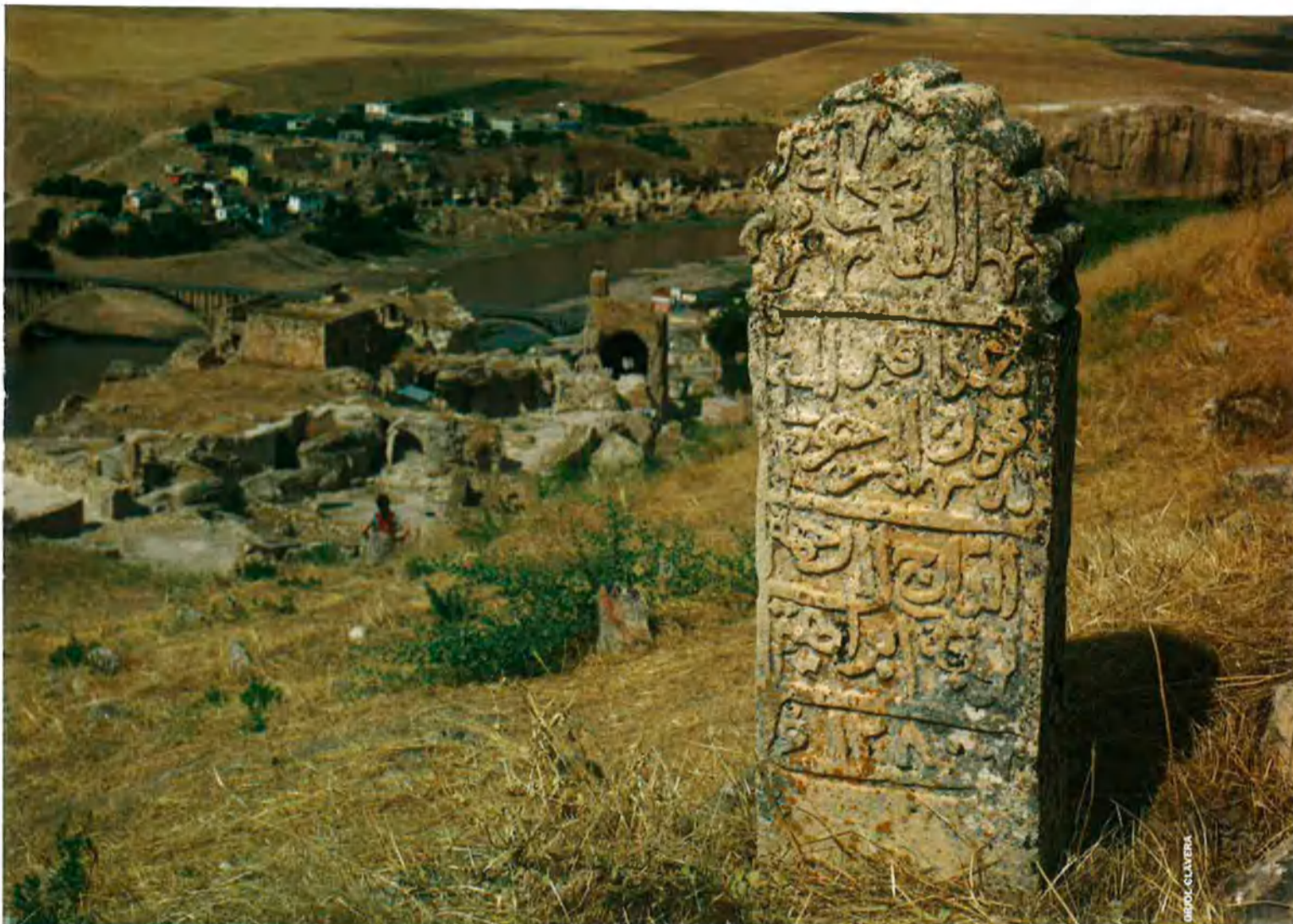
Una pedra mil·lenària, prop de les ruïnes d'una antiga edificació, en un dels turons que envolten el poble de Hasankeyf.