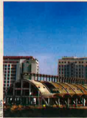
Antiga nau de Cross on anirà la nova església

a la Ciutadania, l'executiu va passar la seua proposta de textos als bisbes, però ells es van negar a negociar i alguns van començar immediatament una campanya en contra."