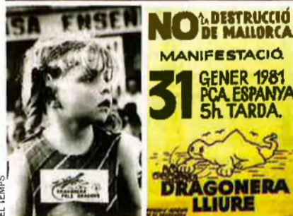
Les primeres lluites ecologistes de les Balears: la salvació de sa Dragonera i des Trenc.

de Mallorca, i a totes les Balears, una idea difusa de proteccionisme territorial i ambiental popular. Els partits polítics –encara a la clandestinitat– no es preocupaven gens ni mica pel medi.