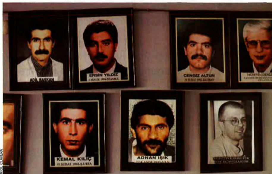
Els retrats d'alguns dels 26 periodistes assassinats són penjats a les parets de la redacció del diari Gundem , el diari kurd més important de Turquia.

nistia Internacional, considera que "cal reformar el sistema de justícia criminal. S'ha de posar la protecció dels drets humans de la ciutadania per sobre dels interessos de les institucions de l'Estat". I també remarca la necessitat d'un cos judicial independent per a investigar d'una manera imparcial i efectiva les denúncies de violació dels drets humans.