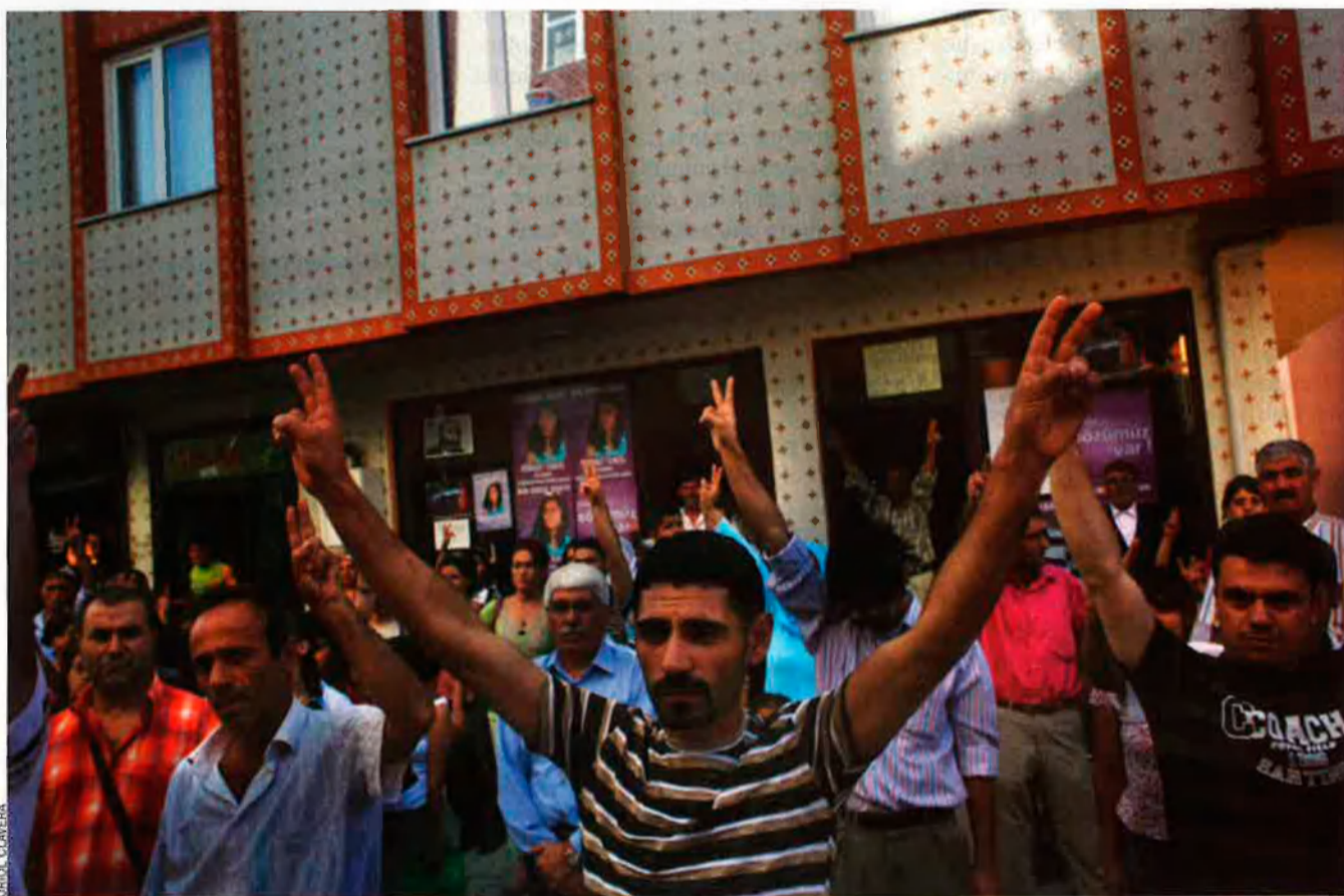
Una colla de seguidors dels candidats independents kurds a les eleccions de diumenge es manifestaven en un carrer d'Istanbul la setmana passada.

Per tal de resoldre aquesta situació, Nicola Duckworth, director del programa per a Europa i Àsia Central d’Am-