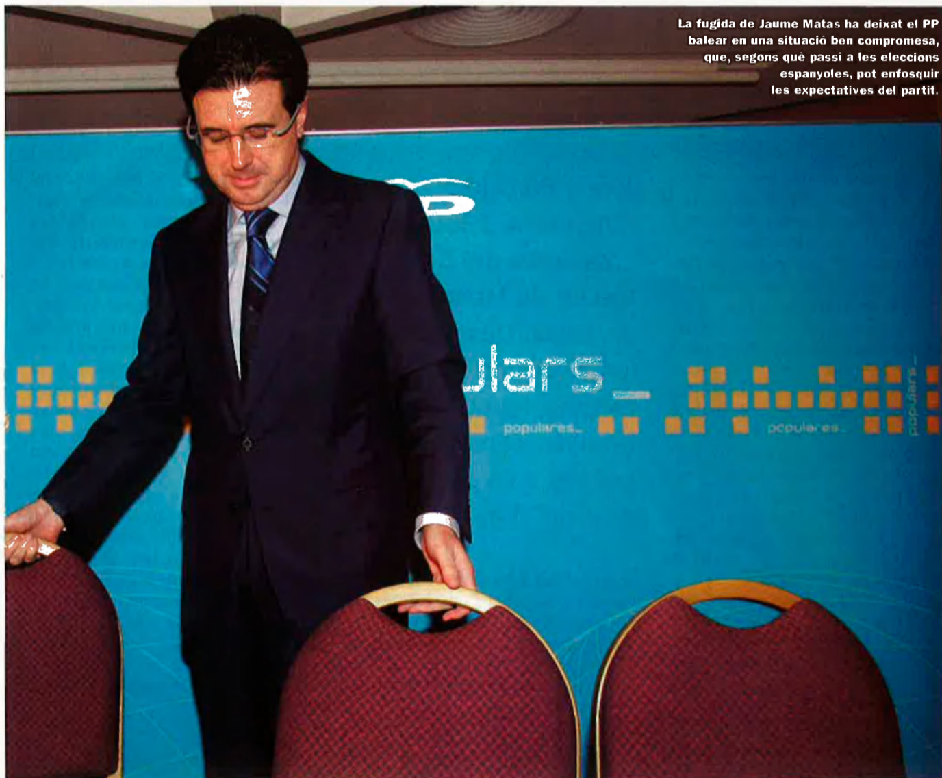
La fugida de Jaume Matas ha deixat el PP balear en una situació ben compromesa, que, segons què passi a les eleccions espanyoles, pot enfosquir les expectatives del partit.