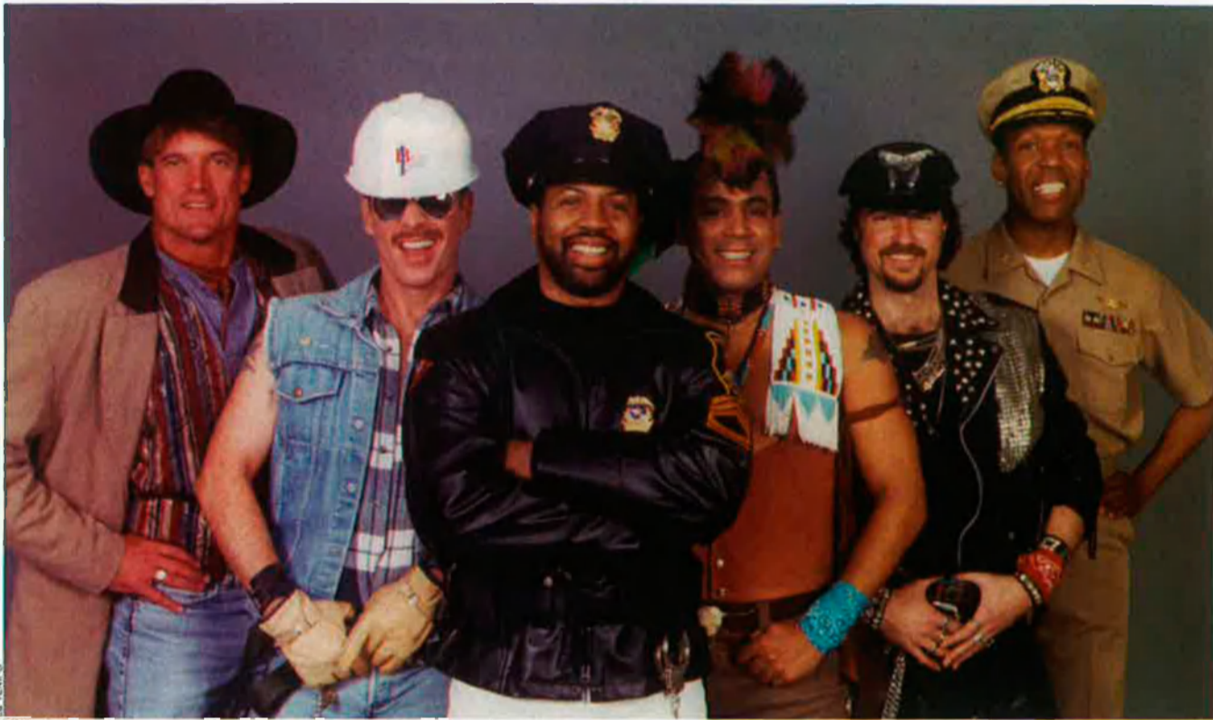
Village People, la cara més pintoresca i comercial de la música gai.

El grup capdavanter del rock gai actual, Scissors Sisters, actuarà ben aviat a Barcelona. Una excusa com qualsevol altra per a acostar-nos a un fenomen que, dels setanta ençà, estripa les convencions amb una explícita voluntat estètica transgressora. Més que purpurina: rock'n'gai.