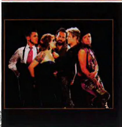
Fangoria, The Ritchie Family i Scissors Sisters, tres icones de l'escena gai.

de les modes i tendències. Malcolm McLaren, un home que es caracteritza pel fet de saber captar allò que es cou en l'ambient, i que ha fet del punk un fenomen social més enllà de la música, prepara els nous escenaris. Amb la seua companya, la dissenyadora Vivienne Westwood, després de l'estètica urbana i violenta del punk, llancen l'estil pirata, un neoromanticisme, amb camises de volants, faixins i pantalons pels genolls. Boy George, el cantant de Culture Club, simbolitzarà aquesta diversitat sexual