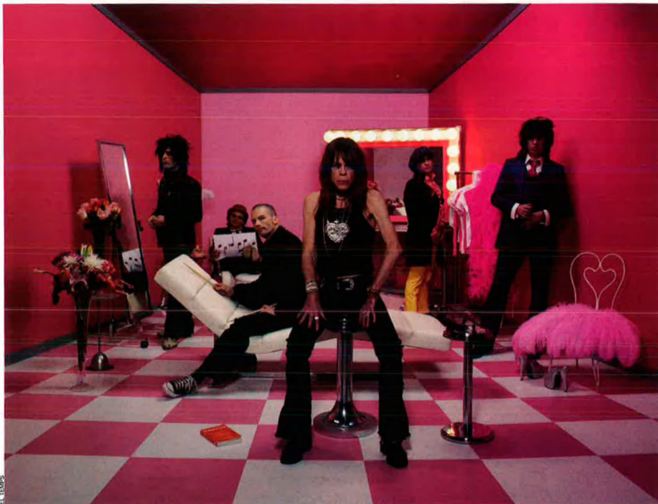
New York Dolls

co, Nova York o Londres. Cantants i grups com David Bowie, T. Rex, New York Dolls, Lou Reed o Roxy Music es presenten com els ambaixadors del rock ambigu . Marc Bolan, anima de T. Rex, serà dels primers a jugar amb una imatge voluntàriament bisexual. Actua als escenaris o ix a la televisió amb un vestuari glamurós i decadent, que fins aquell moment era reservat a les dones o a les estrelles camp de Hollywood. Uns quants decennis més tard, el cantant del grup Placebo, Brian Molko, heretarà aquest gust per l' eye-line i els sons del glam .