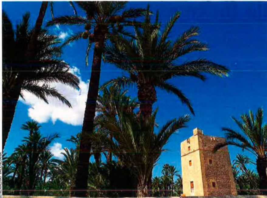
El palmerar d'Elx és una mostra de turisme sostenible urbà, car s'hi valoren els recursos propis.

Turisme sostenible contra devoració del territori. A casa nostra les millors pràctiques de turisme sostenible són als espais rurals de l'interior i als urbans, encara que no tot el que s'hi fa siga perfecte, recorda José Antonio Larrosa. En el cas del turisme rural, és evident que la conservació de l'entorn és bàsica, ja que els recursos naturals són el suport de l'activitat econòmica. En el cas del turisme urbà hi ha ciutats que han recuperat els patrimonis i