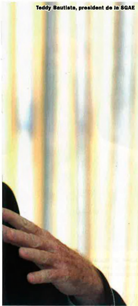
Teddy Bautista, president de la SGAE