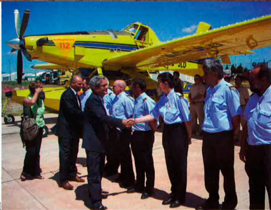
El Departament d'Interior de la Generalitat de Catalunya ha adquirit més vehicles aeris per a combatre el foc amb més eficiència.

L'escenari de risc d'incendis que es dibuixa per a aquest any és semblant al del 2003, un any complicat en què hi hagué incendis importants. La pluja