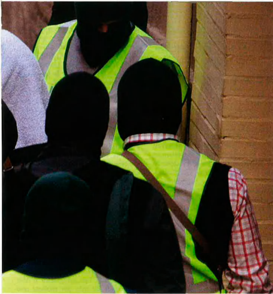
Entre presumptes membres del GSPC a Alacant, el 2005.

El GSPC, amb una gran autonomia d'acció, té per objectiu constituir un estat islàmic a Algèria.