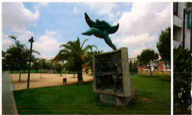
Torrent ha crescut molts els últims anys. Avui té prop de 80.000 ciutadans, però el creixement s'ha produït de manera amable. D'esquerra a dreta, panoràmiques de la ciutat: l'Auditori, un monument als xocolaters del poble en plena àrea d'expansió –"Cap al futur, recordant el passat", diu–; l'avinguda del País Valencià; una allau de grues, a l'entrada, i, a tocar, la Ciutat de l'Esport i el Parc Central, de creació recent. Torrent va rebre, el 2006, el premi estatal a la Ciutat Sostenible.