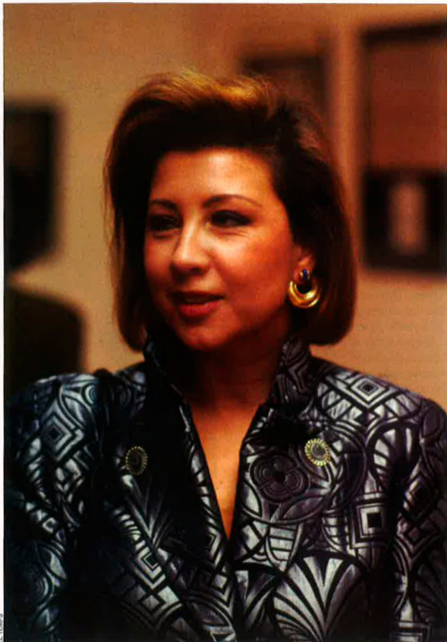
Maria Antònia Munar és la líder indiscutible d'Unió Mallorquina. L'any 1987 va ser nomenada consellera d'Educació i Esports del govern balear presidit per Canellas

El 2003 el PP de Matas assolí la majoria absoluta a les Balears, però no al Consell mallorquí. No tingué cap més remei que anar a cercar la seva cordial enemiga. I Munar, novament, sabé fer-se valer: presidenta de la institució insular per tercera vegada consecutiva. Aquesta mandat del Consell i legislatura del Parlament ha estat tremendament tens entre tots dos socis. Els mitjans de comunicació de dretes han fet una campanya molt dura contra Munar. El PP definí públicament el seu objectiu per al 2007: anorrear UM. La campanya electoral ha estat ferotge. La vice-presidenta del Govern, Rosa Estaràs, número 2 del PP balear, es posà al capdavant de la candidatura al Consell amb la missió d'assolir els disset escons que li haurien donat la majoria absoluta a l'ens insular i, també, a Matas al Parlament, cosa que, òbviament, hauria deixat en no-res UM. Els conservadors estaven segurs