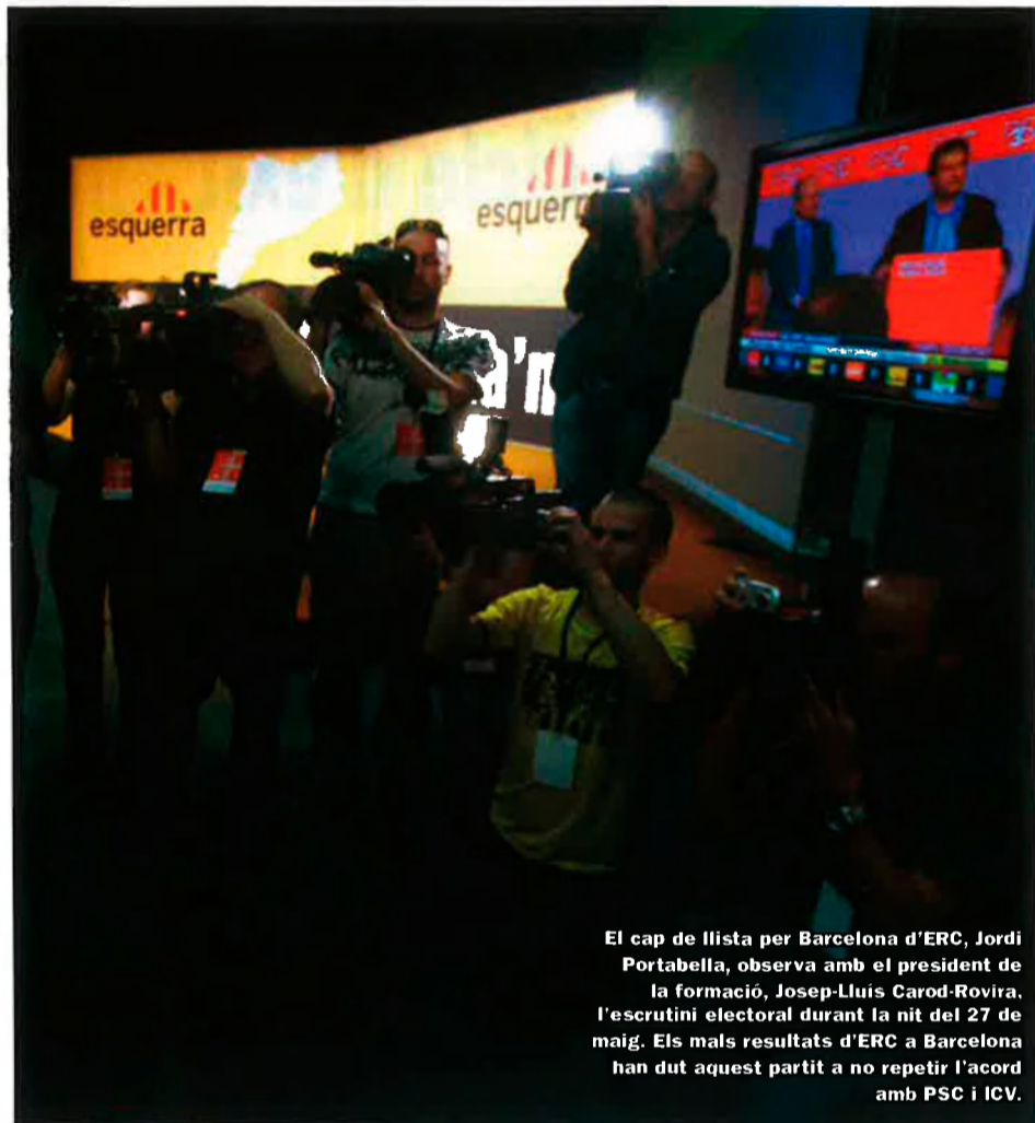
El cap de llista per Barcelona d'ERC, Jordi Portabella, observa amb el president de la formació, Josep-Lluís Carod-Rovira, l'escrutini electoral durant la nit del 27 de maig. Els mals resultats d'ERC a Barcelona han dut aquest partit a no repetir l'acord amb PSC i ICV.

lles reivindicacions. De manera que el vot independentista no veu la utilitat d'estar al govern de la Generalitat. Per això aquests sectors consideren que cal fer compatible "el patriotisme social amb un agenda política" que reculli aquestes reivindicacions.