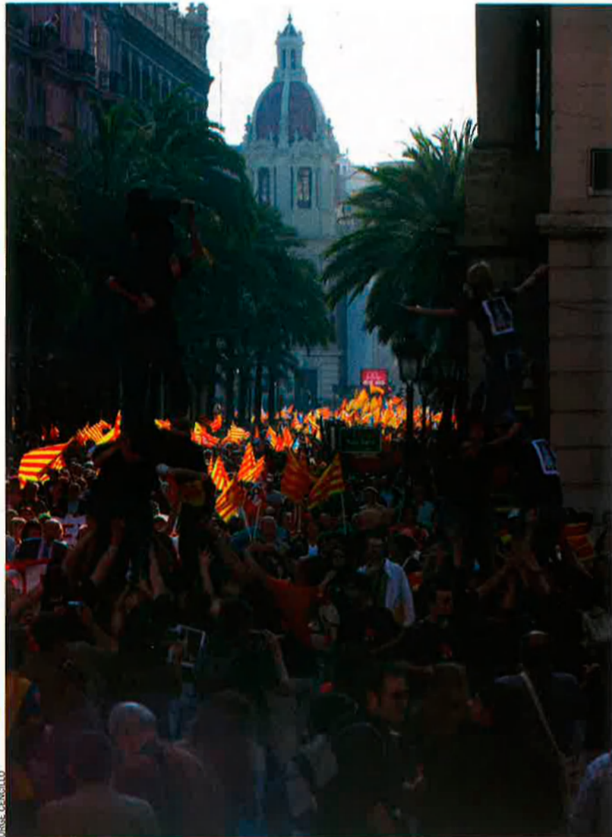
A l'altra pàgina es visualitzen les comarques on el Compromís ha obtingut més vots: coincideix prou amb la força municipal nacionalista. A dalt, manifestació del 5 de maig, a València.

Visualitzar l'espai. És innegable que els resultats del Compromís (EUPV, Bloc, Izquierda Republicana, Esquerra Ecologista i Els Verds del País Valencià) a les eleccions autonòmiques no han respost a les expectatives, si és que eren de fer un total amb els resultats de cadascú a l'anterior contesa. També és cert que, en el trànsit del vot municipal a l'autonòmic, aquest espai que podem anomenar nacional no fidelitza totes les paperetes (no ho fa ara com no ho feia en ocasi-