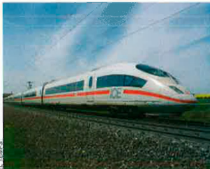
L'Intercity Express (ICE3) és el model de TGV que circula per Alemanya.

Dissenyant el tren del demà. Els fabricants de l'IDE encara recorren a la solució de posar plaques d'acer als extrems del tren per tal de fer-lo més pesant. És una solució simple, que