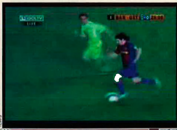
Quan Audiovisual Sport demanà que retiraren les imatges del gol de Lionel Messi, milers de persones ja les havien vistes a YouTube.

ductores de cinema, cadenes de televisió o empreses discogràfiques no volen que els seus productes audiovisuals puguin ser vistos a la xarxa sense autorització. La solució dels creadors de YouTube ha