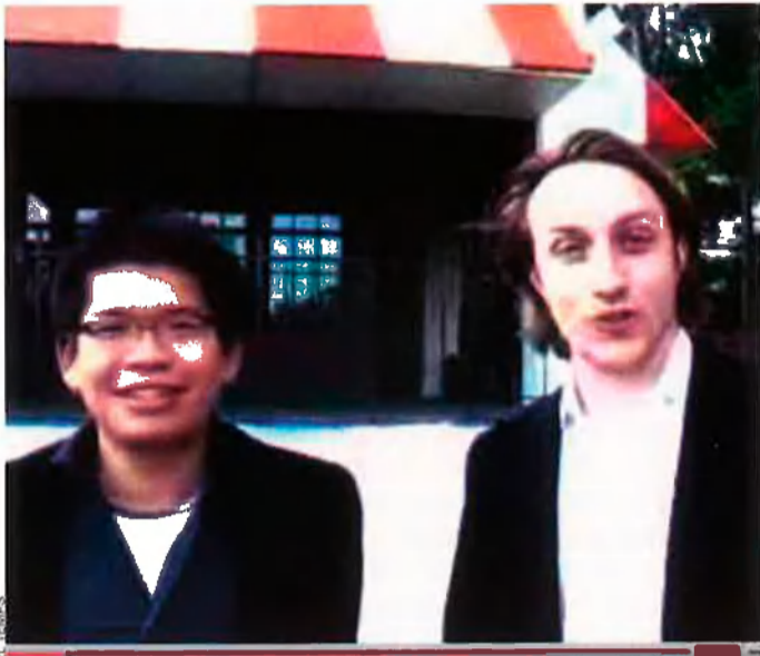
A l'esquerra, dos dels fundadors de la companyia, Steve Chen i Chad Hurley. A la dreta, Jawed Karim, en el primer vídeo que es va penjar a YouTube.