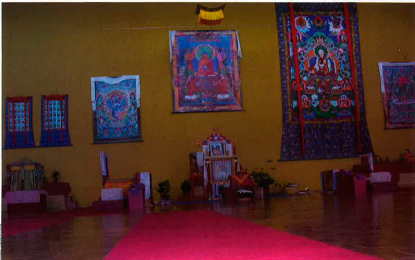
El centre budista Sakya Drogön Ling, a Pedreguer, és un lloc de repòs espiritual i també una mena d'hotel.

fou decidida directament pels lames, el vist-i-plau dels quals és imprescindible en l'expansió de la religió budista arreu del món.