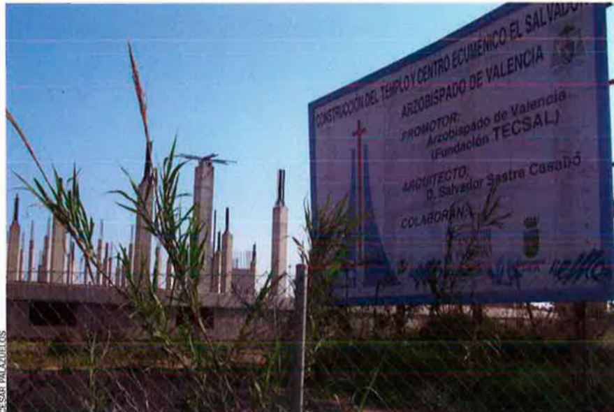
Les obres del centre ecumènic d'Oliva van quedar aturades gairebé des de bon començament, l'any 1998, tot i haver-hi esmerçat vora 5 milions d'euros.