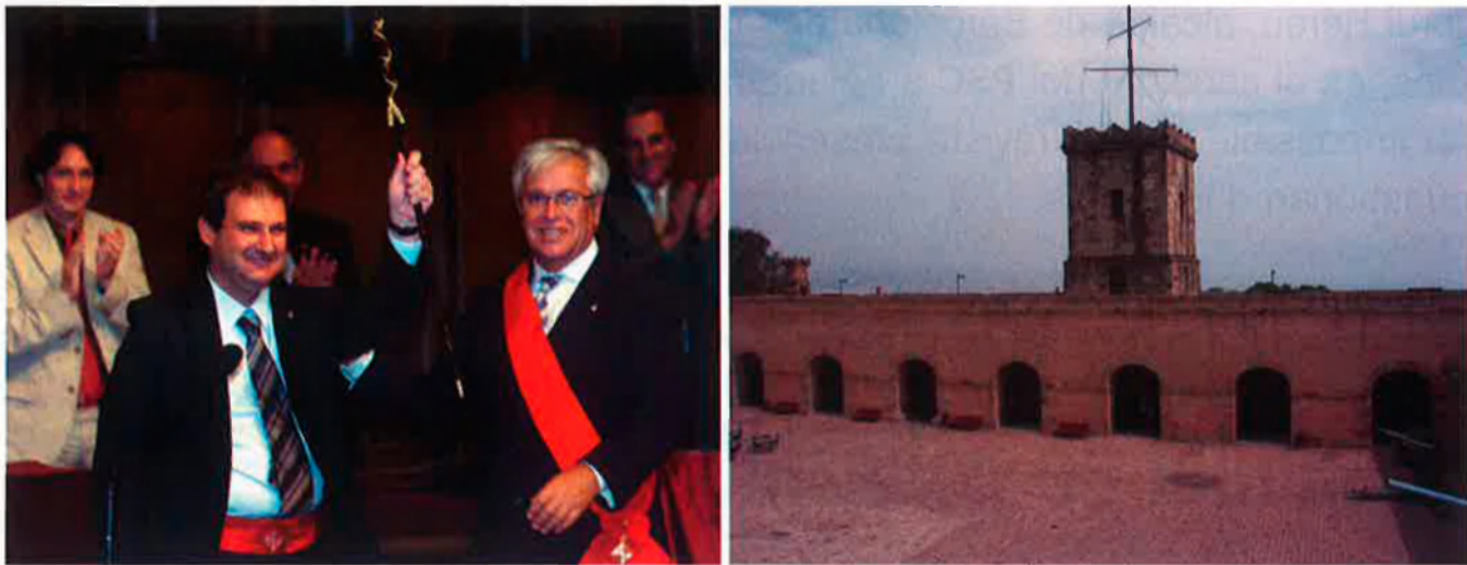
Joan Clos cedeix el càrrec a Jordi Hereu, pocs mesos abans de les eleccions (a l'esquerra). L'alcalde i candidat del PSC ha acceptat un acord de cessió del castell de Montjuïc, amb el govern espanyol, d'esquena al seus socis, ERC i ICV.

ciutat d'una xarxa potent d'equipaments públics, com ara instal·lacions esportives, centres cívics i sanitaris i biblioteques. L'equip de govern ha desenvolupat el Pla de Biblioteques 1998-2010 i, actualment, Barcelona és una de les poques ciutats d'Europa que compta amb una trentena de biblioteques públiques. La construcció d'habitatge social, tot i no arribar als 10.000 pisos de protecció promesos, i la rehabilitació del parc immobiliari de la ciutat han acaparat bona part de l'acció municipal. Durant el 2005, un de cada tres pisos construïts era de protecció oficial i ara mateix hi ha 15 barris de la ciutat declarats àrees de rehabilitació integral, com el Turó de la Peira o el Bon Pastor.