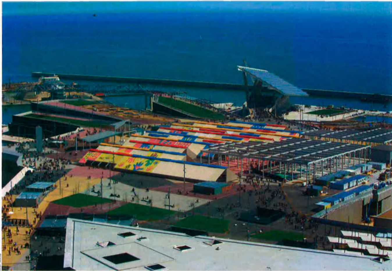
El Fòrum de les Cultures 2004 evidencià el final d'una etapa de transformació de la ciutat a còpia de grans esdeveniments.