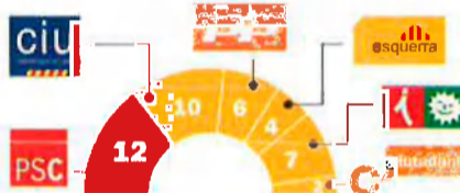
■ LES ENQUESTES DEL CIS Participació: 53%