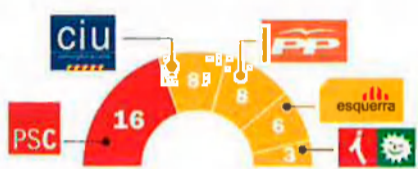
■ EXTRAPOLACIO DE LES ELECCIONS AUTONÒMIQUES DEL 2006 Participació: 60,6%