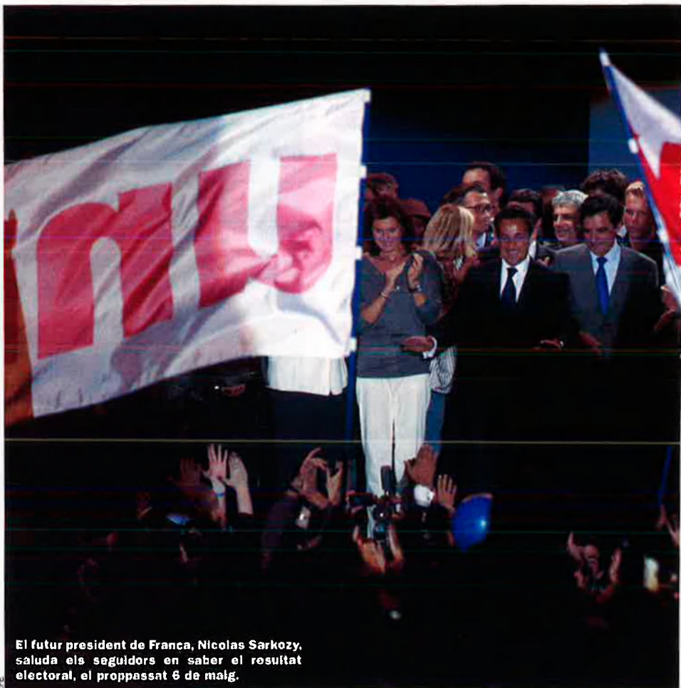
El futur president de França, Nicolas Sarkozy, saluda els seguidors en saber el resultat electoral, el propassat 6 de maig.

Nicolas Sarkozy, que és un gaullista genèticament modificat, liberal i conservador alhora, simbolitza l'apoteosi del nou-ric francès a començament del segle XXI. No ha de menester pintors, en té prou amb la televisió; però sembla que l'escriptora Yasmina Reza publicarà el setembre un llibre sobre ell. És l'afinitat dels fills d'immigrants? La de la gent d'origen jueu? En tot cas, amb ell arriben al poder no sols Bolloré, sinó també Arnaud Lagardère –l'hereu d'Hachette i Matra, insòlit accionista d'EADS (al pare Lagardère sí que li interessava l'aeronàutica)– o Martin Bouygues –una fortuna feta en el ram de la construcció, consolidada a la TV privada i multiplicada a la telefonia mòbil. És el candidat del CAC40, l'equivalent francès de l'IBEX-35, la vitrina de les empreses mundialitzades, que van bé dins d'un país que va malament. Sarkozy és un home en sintonia amb una època que prefereix els financers als industrials, els inversors als propietaris, els fons de pensions a les grans famílies, la borsa a les fàbriques,