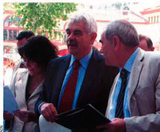
Pasqual Maragall, amb el seu germà, Ernest, durant la celebració de la diada d'Europa. L'ex-president català ha fet evident la seva decepció amb el procés estatutari.

La incògnita de C's. A les passades eleccions catalanes, la sorpresa fou Ciutadans-Partit de la Ciutadania (C's), amb l'obtenció de 3 diputats. L'èxit d'aquesta formació fou especialment remarcable en algunes poblacions on va aconseguir resultats propers o superiors al 5% de suport, el percentatge necessari per a obtenir representació municipal. En poblacions com Badalona, Barcelona, Esplugues de Llobregat, Santa Coloma de Gramenet, Cornellà, Tarragona o Gavà, la formació espanyolista es va acostar al 5 per cent. Mentre que a poblacions com Sant Andreu de la Barca, Sant Cugat del Vallès, Sant Joan Despí, Salou, Badia del Vallès o Castelldefels