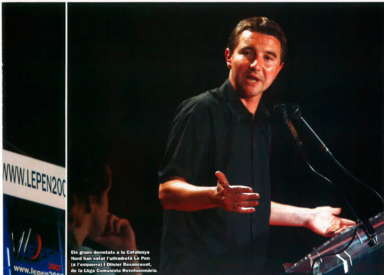
Els grans derrotats a Catalunya Nord han estat l'ultradretà Le Pen (a l'esquerra) i Olivier Besancenot, de la Lliga Comunista Revolucionària.

en trau profit. De fet, l'única causa és el vot tan fort a Bayrou, el 29,61%. Així, la LCR de Besancenot (3,9%) i el PC de Marie-Georges Buffet (1,67%) obtenen uns percentatges fins i tot per sota de Catalunya Nord o de l'estat francès, que s'han de posar en relació, però, amb una taxa de participació especialment alta, del 87,21%. A les viles d'Iparalde, l'entusiasme pro-Bayrou, menys evident, afavoreix Nicolas Sarkozy, que obté fins al 38,05% a Biarritz.