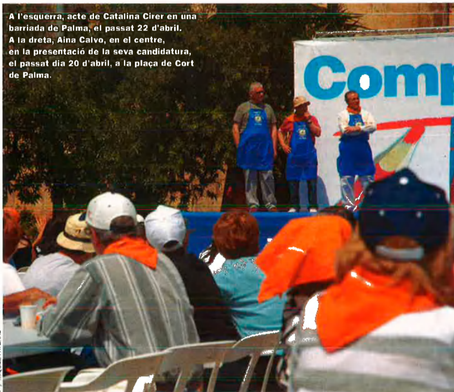
A l'esquerra, acte de Catalina Cirer en una barriada de Palma, el passat 22 d'abril.

ment, delegada del Govern a Balears. Va ser el càrrec a partir del qual adquirí molta notorietat pública. El seu caràcter populista la feia aparèixer sovint pels mitjans: ara vestida de pagesa ballant boleros –juntament amb una filla seva, aleshores molt petita–, suara disfressada pel carnaval, altres cops amb la samarreta del Mallorca –és una gran aficionada– animant l'equip al camp de futbol, i sempre amb la seva aparença de persona del poble: senzilla, sense sofisticacions en el vestir i no gaire preocupada per la imatge. L'esquerra menystenia Cirer, no creia que pogués guanyar les eleccions. Tanmateix, en tancar-se les urnes els resultats ben aviat mostraren l'equivocació que havien comès els progressistes. Cirer