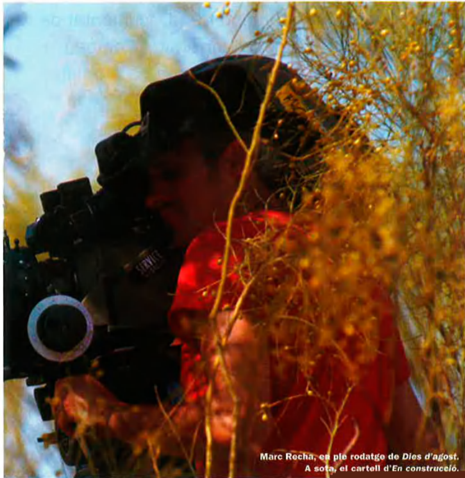
Marc Recha, en ple rodatge de Dies d'agost . A sota, el cartell d' En construcció .

per exemple de Ciències Polítiques, de Belles Arts i d'Història. Així mateix, també la procedència geogràfica dels alumnes és prou variada, i, si bé la majoria arriben al màster provinents d'universitats de Barcelona, també n'hi ha que hi arriben d'universitats de Llatinoamèrica, més que no pas, fins i tot, d'universitats espanyoles o d'altres països d'Europa.